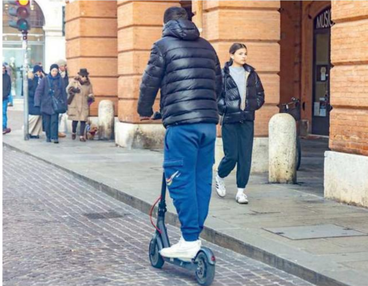
Un uomo con il monopattino senza casco (foto di archivio)

Nell'ultimo week-end i militari delle stazioni di Capoliveri, Portoferraio e Rio, coadiuvati da una pattuglia di motociclisti dell'Aliquota Radiomobile di Portoferraio, hanno effettuato diversi controlli agli utenti della strada. A Portoferraio, proprio sulla base delle nuove norme, i carabinieri hanno fermato e sanzionato un uomo per mancato uso del casco sul monopattino. La sanzione prevista ammon-